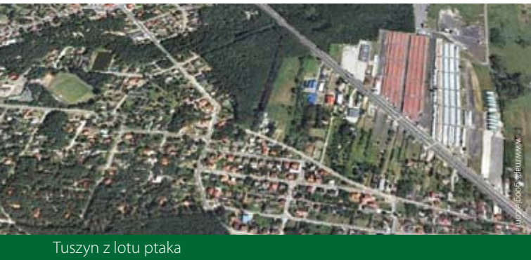
Tuszyn z lotu ptaka