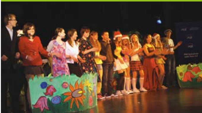
Spektakl Czerwony Kapturek podczas Radomszczańskich Spotkań Integracyjnych

2 grudnia zgromadzona w Miejskim Domu Kultury publiczność obejrzała spektakle przygotowane przez Teatr Rekwizytornia, Koło Dzieci Niepełnosprawnych z MDK w Radomsku, Teatrzyk Baśniowy z Ośrodka Szkolno-Wychowawczego czy Teatr „Póki co” z Domu Pomocy Społecznej i Gimnazjum w Radziechowicach.