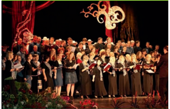
W festiwalu udział wzięło 5 chórów z Polski i z zagranicy

W dniach 26-27 czerwca Radomsko już po raz szósty gościło chóry zza wschodniej i zachodniej granicy. Wszystko za sprawą Międzynarodowego Festiwalu Chóralnego Wschód-Zachód-Zbliżenia, w którym udział wzięły zespoły z Siedlec, Lwowa, Jablonkova, Monachium i Radomska. Festiwal przyjął formułę prezentacji bardzo różnorodnej