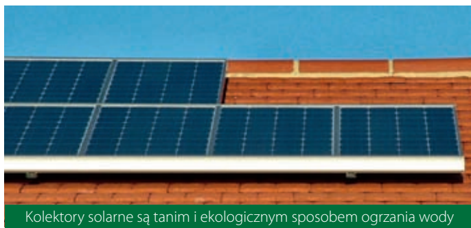
Kolektory solarne są tanim i ekologicznym sposobem ogrzewania wody

Zestawy solarne to ekologiczny sposób ogrzewania wody. Technologia ta cieszy się coraz większym zainteresowaniem. Teraz, dzięki preferencyjnemu kredytowi udzielanemu przez ESBANK Bank Spółdzielczy, zakup takiego zestawu będzie tańszy i zdecydowanie łatwiejszy.