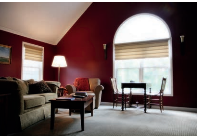
Zastanów się, jakie wymagania ma spełniać Twój wymarzony dom

Zakup domu, mieszkania czy działki budowlanej to jedna z najważniejszych decyzji w życiu. Specjalnie dla Ciebie prezentujemy więc krótki poradnik, który pomoże Ci uniknąć błędów często popełnianych przez kupujących.