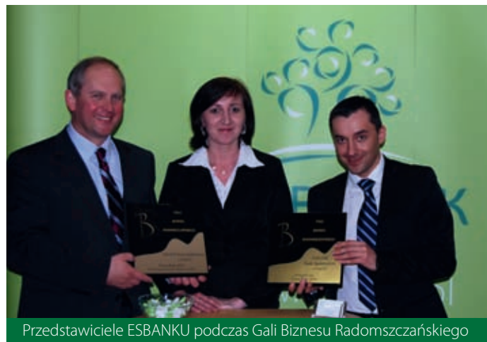
Przedstawiciele ESBANKU podczas Gali Biznesu Radomszczańskiego

Cieszymy się, że nasz Bank znalazł się w gronie najlepszych firm z terenu radomszczańskiego – otrzymane certyfikaty są bowiem potwierdzeniem siły, stabilności i solidności oraz wpisują się w nasze hasło "Jesteśmy najbliżej".