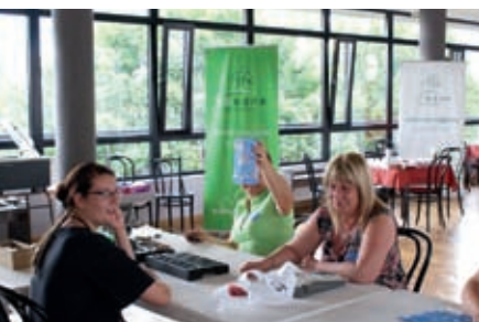
Nasze kasjerki zliczały pieniądze dostarczane przez wolontariuszy

4 lipca na ulice polskich miast wyruszyli wolontariusze Wielkiej Orkiestry Świątecznej Pomocy. Tym razem zbierali pieniądze na sprzęt niezbędny w usuwaniu skutków powodzi, który zostanie przekazany strażom pożarnym.