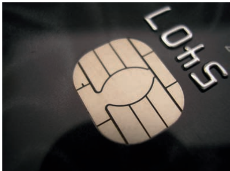
Obecność mikroprocesora zwiększa bezpieczeństwo

przez specjalny czytnik oraz sprawdzeniu podpisu lub wprowadzenia PINu. Karta chipowa natomiast musi znajdować się w czytniku przez cały czas przeprowadzania transakcji.