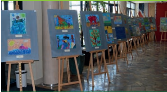
Nagrodzone prace prezentowano na wystawie w MDK-u

Aż 1955 uczestników ze 192 miejscowości wzięło udział w II Ogólnopolskim Integracyjnym Konkursie Plastycznym zorganizowanym przez Specjalny Ośrodek Szkolno-Wychowawczy w Radomsku i ESBANK Bank Spółdzielczy. Zadaniem uczestników było stworzenie ilustracji do wiersza Jana Brzechwy „Na wyspach Bergamutach”. Na przygotowanych przez dzieci pracach można było zobaczyć kota w butach, wieloryba w okularach i innych bohaterów wiersza polskiego poety. Jury postanowiło w dziewięciu kategoriach przyznać 15 miejsc I, 15 miejsc II, 6 miejsc III, 11 wyróżnień i 48 kwalifikacji na wystawę.