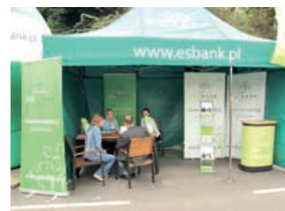
Stoisko ESBANKU na Dniach Radomska

„Lato z powiatem”, odbywającego się w Lgocie Wielkiej. Podczas imprez prezentowaliśmy naszą ofertę na stoiskach promocyjnych i rozdawaliśmy gadżety z logo Banku. Największym zainteresowaniem, szczególnie wśród najmłodszych, cieszyły się esbankowe balony.