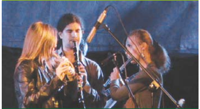
Młodzież z Big Bandu Radomsko ćwiczyła pod okiem wybitnych muzyków

Członkowie Big Bandu Radomsko wzięli udział w VIII Międzynarodowych Warsztatach Jazzowych odbywających się w dniach 6-11 sierpnia w Lesznie. Ich organizatorem była Fundacja Edukacyjna „Pro Musica”.