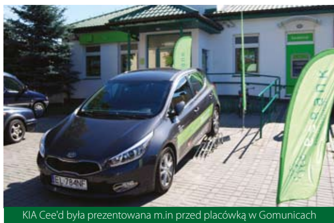
Kia Cee'd była prezentowana m.in. przed placówką w Gorniczych

W ramach promocji lokaty przez pierwsze trzy tygodnie lipca auto KIA Cee'd można było oglądać przed placówkami ESBANKU. Samochód wzbudzał duże zainteresowanie wśród przechodniów, którzy często zatrzymywali