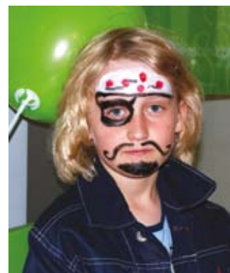
W Kleszczowie na najmłodszych czekało wiele atrakcji, m.in. malowanie twarzy

(budynek POLOmarketu), jest otwarta od poniedziałku do piątku w godzinach 9.00 – 17.00.