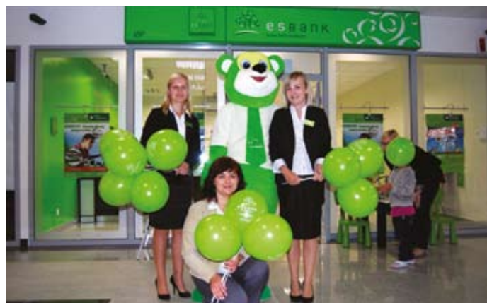
Pracownicy filii w Kleszczowie zapraszali do odwiedzin placówki

Od 28 maja 2012 roku w Kleszczowie działa nowa, dwudziesta dziewiąta, placówka naszego Banku. Placówka świadczy kompleksowe usługi związane z obsługą rachunków i lokat, udzielaniem kredytów czy sprzedażą ubezpieczeń.