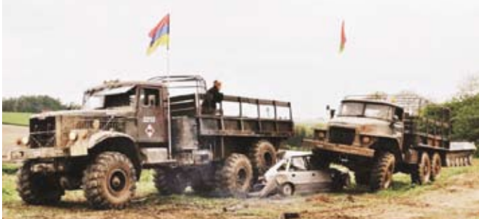
Ogromne ciężarówki z łatwością miażdżyły auta

W sobotę 12 maja uczestnicy zlotu w asyście policjantów przybyli do Radomska, gdzie zwiedzający mogli oglądać pojazdy i ich oryginalnie przebranych właścicieli. W niedzielę rano wśród przygotowanych atrakcji znalazł się crash tank, podczas którego dwie ciężarówki miażdżyły samochody osobowe. Widowisko przyciągnęło wielu widzów, a cała impreza spotkała się z bardzo dużym zainteresowaniem.