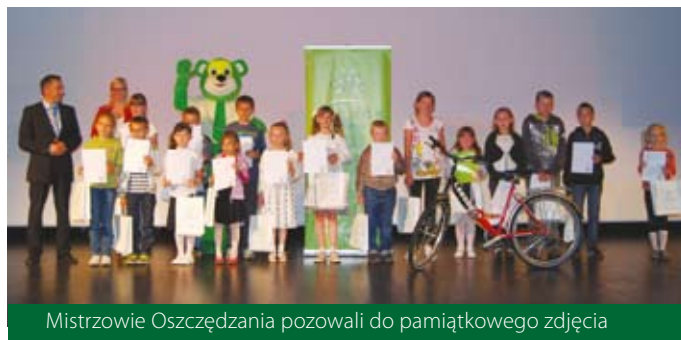
Mistrzowie Oszczędzania pozowali do pamiątkowego zdjęcia