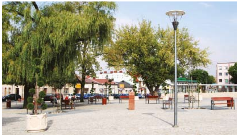
Kłobucki Rynek im. Jana Pawła II