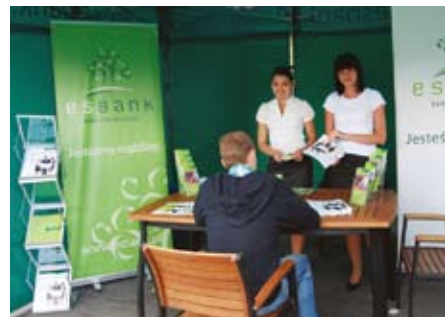
Na stoisku ESBANKU klienci otrzymywali informacje m.in. o kredycie solarnym

Kredyt na zakup i montaż kolektorów słonecznych dostępny jest w ofercie ESBANKU od 2010 r. Nasi Klienci mają możliwość uzyskania dofinansowania z NFOŚiGW w wysokości 45% kosztów kwalifikowanych inwestycji. Dzięki temu oprócz niższych rachunków za ogrzewanie oszczędzają także na zakupie i montażu instalacji solarnej.