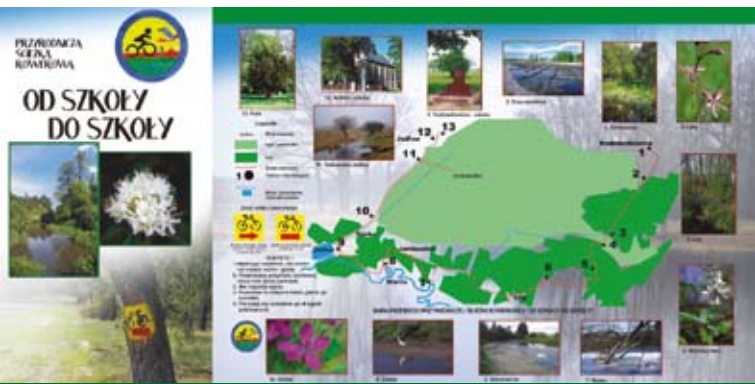
Na terenie gminy znajduje się Przyrodnicza Ścieżka Rowerowa