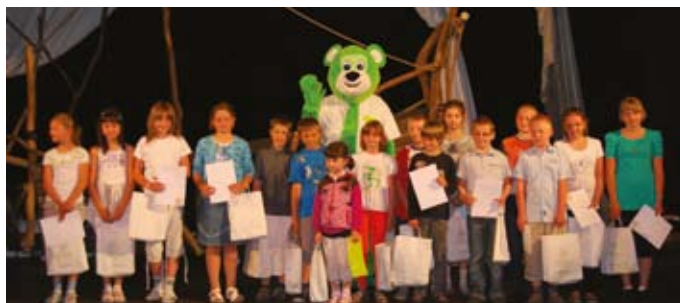
Mistrzowie Oszczędzania na pamiątkowej fotografii

Na scenie upominki wręczono także pozostałym dzieciom oraz opiekunkom SKO. Gratulujemy wszystkim nagrodzonym!