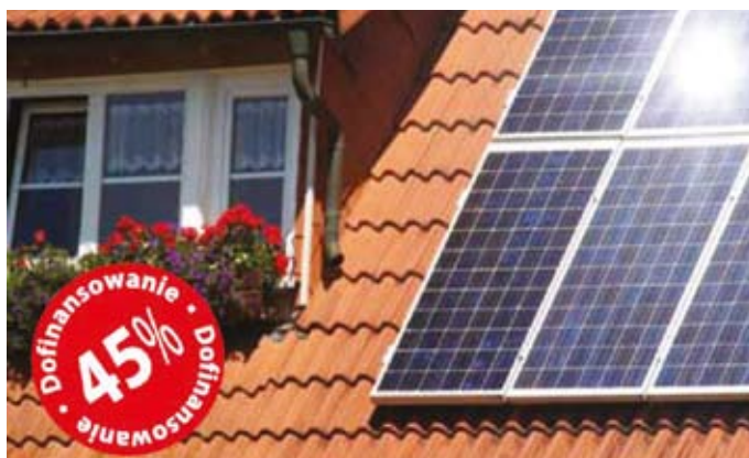
Z NFOŚiGW można otrzymać 45% dofinansowania na zakup i montaż kolektorów słonecznych