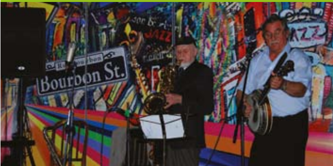
Ultradycyjne Duo na scenie pubu Bourbon Street

Sponsorem koncertu, zorganizowanego przez Stowarzyszenie Jazzowe Bourbon Street, był ESBANK Bank Spółdzielczy.