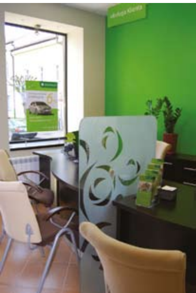
Kolejne placówki ESBANKU zyskają nowoczesny wygląd

W ostatnich tygodniach na naszych placówkach zaszło sporo zmian. Jedna placówka zyskała nowe wnętrze, druga została przeniesiona do nowej siedziby.