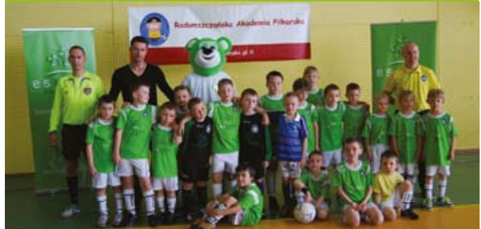
Młodzi piłkarze z ESBANK RAP

8 maja Radomszczańska Akademia Piłkarska świętowała swoje pierwsze urodziny. Z tej okazji w Radomsku odbył się turniej ESBANK CUP. Towarzyszyły mu wielkie emocje zarówno ze strony młodych piłkarzy, jak też kibicujących im rodziców. Organizację turnieju, podobnie jak działalność RAP, wsparł ESBANK Bank Spółdzielczy.