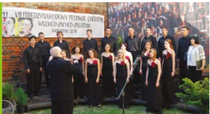
Chór z Drohobycza podczas koncertu na dziedzińcu Muzeum Regionalnego

Ale w turnieju to nie wygrana była najważniejsza, a sama gra i dobra zabawa. Dlatego też nagrodzeni zostali wszyscy młodzi piłkarze – każda drużyna otrzymała puchar, medale, dyplomy i drobne upominki.