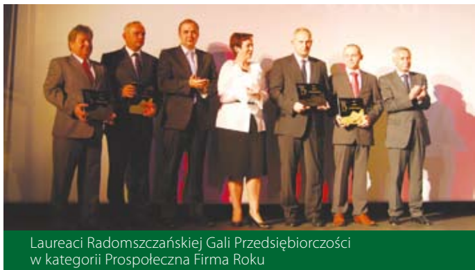
Laureaci Radomszczańskiej Gali Przedsiębiorczości w kategorii Prospołeczna Firma Roku

Dziękujemy za to wyróżnienie, które jest potwierdzeniem naszej działalności lokalnej.